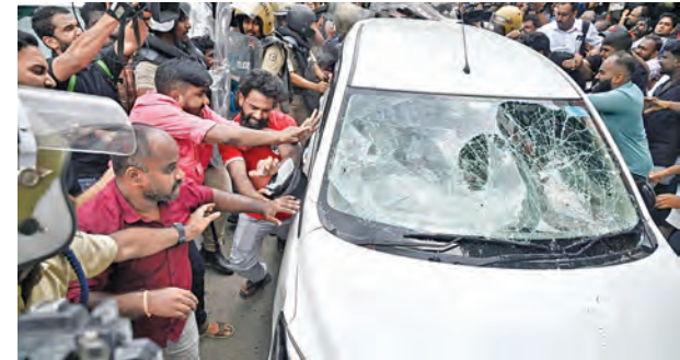
బుధవారం తిరువనంతపురంలోని విజయన్ నివాసంలో సోదాలు పూర్తిచేసి వెళ్తున్న ఇడి అధికారుల వాహనాన్ని ధ్వంసం చేసిన నిరసనకారులు

హైదరాబాద్, మే 27, ప్రభాతవార్త: మండే ఎండలు, ఉక్కుపోతతో అల్లాడుతున్న జనానికి మంగళవారం అర్ధ రాత్రి కురిసిన వర్షం కాస్త చల్లదనంతో ఉపశమనం కలిగిస్తే ఆకాశానికి బిల్లు పడిందా అన్నట్లు కురిసిన అదే అకాలవర్షం అన్నదాతలను నిదా ముం చేసింది. రెండు రోజులుగా ఎండలతో అల్లాడిపోయిన తెలుగు రాష్ట్రాల ప్రజలకు అర్ధరాత్రి వేళ వాతావరణం చల్లబడి ఉపశమనం లభించినప్పటికీ అనే వర్షాల రైతుల గుండెల్లో మాత్రం మంటలు రేపాయి. పలు జిల్లాల్లో మంగళవారం అర్ధరాత్రి ఉరుములు, మెరుపులు, బలమైన ఈదురుగాలులతో అకాల వర్షం కురిసింది. దీంతో మార్కెట్ యార్బుల్లో రోడ్లపై ఆరబోసిన పరి ధాన్యం, మొక్కజొన్న పంటలు నీటిపాలయ్యాయి. ఆరుగాలం కష్టపడి, చెమటోడ్ని పండించిన పంట కళ్ల ముందే వరద పాలవడంతో రైతున్నలు కన్నీరు ముసిగిస్తున్నారన్నారు. కొనుగోలు కేంద్రాల్లో అధికారుల నిరక్షణ్ణ ఒకవైపు, ప్రకృతి కన్నెల్ >>2