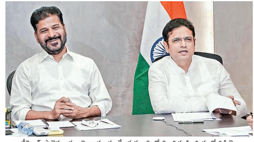
టీపైబర్ ప్రాజెక్టు అమలుపై బుధవారం కేంద్ర మంత్రి జ్యోతిరాదిత్య సిందియాతో విడియో కాన్ఫరెన్స్ లో మాట్లాడుతున్న సీఎం రేవంత్. చిత్రంలో మంత్రి డి. శ్రీధర్ బాబు

ప్రభాతవార్త ప్రధాన ప్రతినిధి, హైదరాబాద్, మే 27: అమెండేడ్ భారత్ నెట్ ప్రోగ్రామ్ (ఎ.బి.ఎం) కింద తెలంగాణలో టీపైబర్ ప్రాజెక్టు అమలుపై కేంద్ర మంత్రి జ్యోతిరాదిత్య సిందియాతో ముఖ్యమంత్రి డి. రేవంత్ రెడ్డి, పరిశ్రమలు, ఇటీ శాఖ మంత్రి డి. శ్రీధర్ బాబుతో కలిసి వీడియో కాన్ఫరెన్స్ లో పాల్గొన్నారు. అమెండేడ్ భారత్ నెట్ ప్రోగ్రాం సజావుగా అమలు చేసే దిశగా ముఖ్యమంత్రి కొన్ని కీలక అంశాలను సిందియా దృష్టికి తీసుకువెళ్లారు. అమలుకు సంబంధించిన ఒప్పందాన్ని త్వరితగతిన కుదుర్చుకోవడం, పెండింగ్ లో ఉన్న నిధుల విడుదలను వేగవంతం చేయడంపై పుచ్చుకున్నారు. మండలం నుండి గ్రామ పంచాయతీ రింగ్ నెట్ వర్క్ అమలుపై డిజిటల్ భారత్ నిధికి బదిలీ >>2